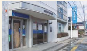
▲東日本大震災発生直後の大船渡支店 (2011年3月)

多くの皆さまにこの展示室をご覧いただき、東北各地域の災害体験が風化することなく、後世に伝えられていくことで、今後の災害時対応の一助となれば幸いに存じます。