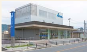
▲新店舗移転オープンした大船渡支店 (2020年6月)