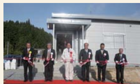
▲高田支店仮店舗オープンセレモニー (2011年11月)