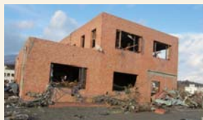
▲東日本大震災発生直後の高田支店 (2011年3月)